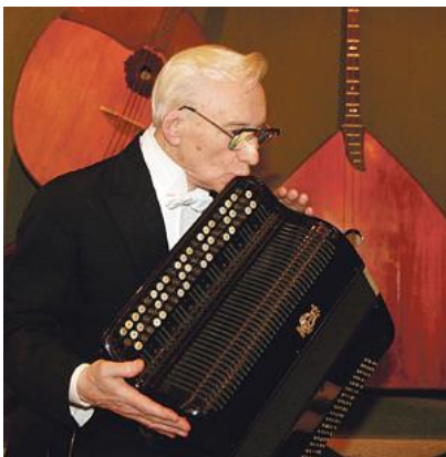
Казakov Юрий Иванович (р. 1924 г.)

Первый советский баянист, удостоенный в 1985 году почетного звания «Народный артист СССР»