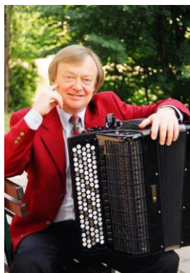
Липс Фридрих Робертович (р. 1948 г.)

Заслуженный артист РСФСР, победитель Международного конкурса в Клингентале (1969 г.).